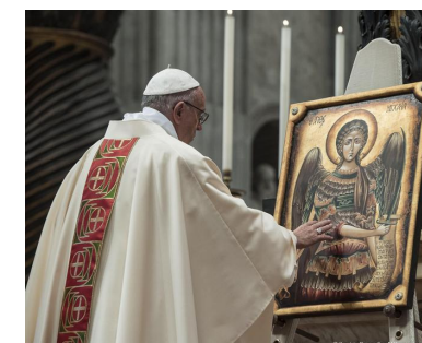
Arcangelo Michele papa Francesco 16 feb 2017

Nel periodo della festa di comunità, dal 25 agosto al 3 settembre prossimi, sarà allestita la mostra «Bellezza via di grazia», un percorso iconografico costituito da una quarantina di icone realizzate dall'iconografa Francesca Pretto della «Scuola diocesana di iconografia "San Luca"» di Padova. L'occasione è propizia per accostare questa forma di «arte sacra» scaturita dalla tradizione spirituale ortodossa, cioè delle Chiese d'Oriente, per la quale anche in Occidente è cresciuto l'interesse già da alcuni decenni.