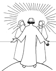
«Maestro, è bello per noi essere qui».

In quel tempo, Gesù prese con sé Pietro, Giovanni e Giacomo e salì sul monte a pregare. Mentre pregava, il suo volto cambiò d'aspetto e la sua veste divenne candida e sfolgorante. Ed ecco, due uomini conversavano con lui: erano Mosè ed Elia, apparsi nella gloria, e parlavano del suo esodo, che stava per compiersi a Gerusalemme. Pietro e i suoi compagni erano oppressi dal sonno; ma, quando si svegliarono, videro la sua gloria e i due uomini che stavano con lui. Mentre questi si separavano da lui, Pietro disse a Gesù: «Maestro, è bello per noi essere qui. Facciamo tre capanne, una per te, una per Mosè e una per Elia». Egli non sapeva quello che diceva. Mentre parlava così, venne una nube e li coprì con la sua ombra. All'entrare nella nube, ebbero paura. E dalla nube uscì una voce, che diceva: «Questi è il Figlio mio, l'eletto; ascoltatelo!». Appena la voce cessò, restò Gesù solo. Essi tacquero e in quei giorni non riferirono a nessuno ciò che avevano visto. (Luca 9, 28-36)